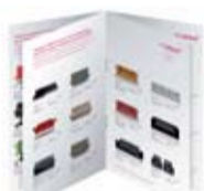
Cosido de folletos