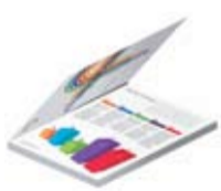
Encuadernado en rústica

La Serie imagePRESS C7010VP ofrece verdadera diversidad de aplicaciones gracias a su manejo flexible de los soportes, un potente acabado y una fiabilidad excepcional.